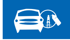
燃气汽车管路检查 Piping detection of Natural Gas Vehicles